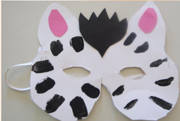
Να η ζέβρα μας