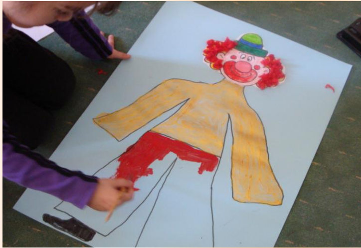
Ομαδική εργασία : "Μεγάλος κλόουν" .