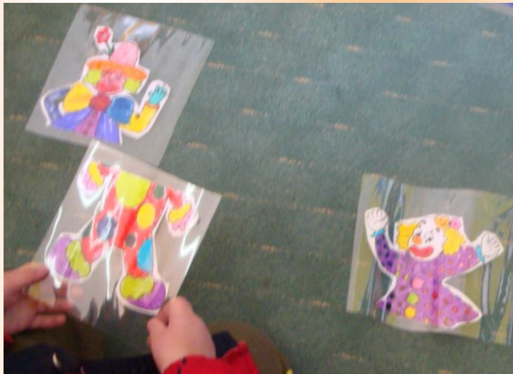
Βρες το άλλο μισό του κλόουν