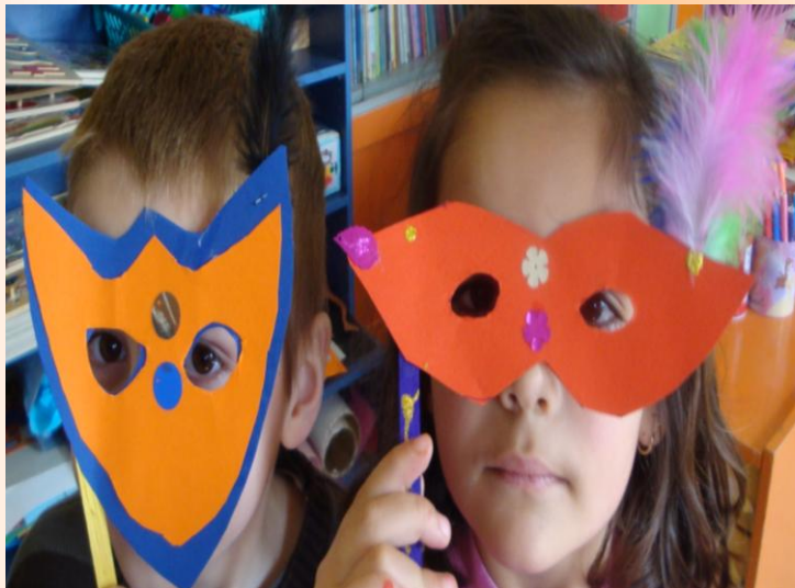
Μικρές μάσκες για κύριους και κυρίες